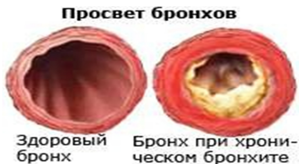
Рис. 1 Просвет бронхов

Размещаемые в тексте иллюстрации следует нумеровать арабскими цифрами по центру текста, например: